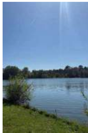
Lac de Cap-de-Bos

Avec ses larges voies, son lac artificiel et ses espaces verts, Cap-de-Bos propose un environnement paisible et agréable. « Ce lac, c'est un peu le cœur du quartier, tout le monde y passe à un moment