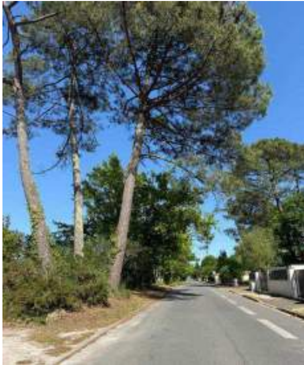
Avenue de la Californie

Cap-de-Bos, à l'ouest de Pessac, est un quartier qui a su évoluer tout en préservant son identité. Son nom, issu du gascon, signifie « le sommet de la forêt », rappelant son passé boisé avant son urbanisation dans les années 1970-80. Aujourd'hui, il offre un cadre de vie recherché, entre nature et dynamisme associatif.